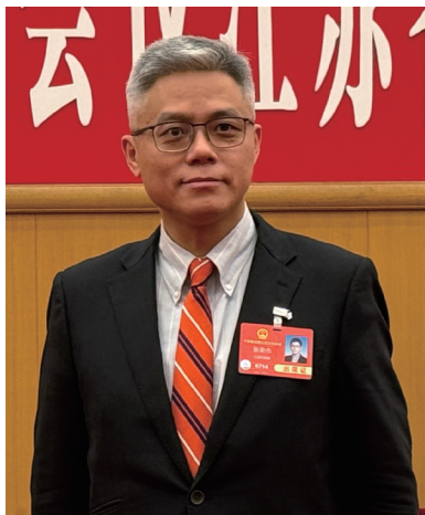
全国人大代表张俊杰。

“我国对 ADHD（注意缺陷多动障碍，俗称多动症）儿童的教育支持仍处于起步阶段，亟需国家教育行政部门从‘认知普及—政策保障—资源落地’多层次推进系统性改革，构建科学合理的包容性教育环境，让 ADHD 学生能发挥潜能，减少伤害，实现‘一个都不能少’的教育目标。”全国两会期间，全国人大代表、南京市第一医院副院长张俊杰提交了“关于加强中小学校对 ADHD 学生教育支持的建议”，呼吁各方携手，为 ADHD 儿童营造理解、接纳、宽容和支持的学习与成长环境，让每一名孩子都能在阳光下茁壮成长。