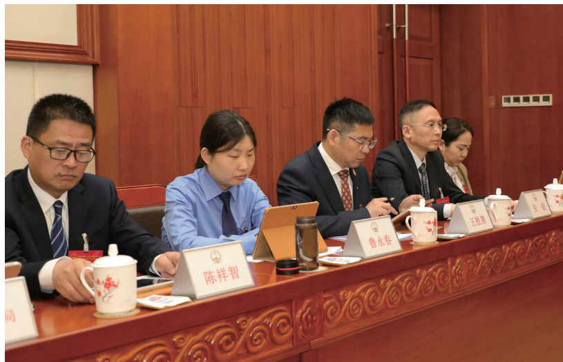
4月28日至29日，市十七届人大常委会第十七次会议召开，会议邀请部分市人大代表列席。

市委常委、副市长霍慧萍，副市长李晖，市中级人民法院院长李后龙，市人民检察院检察长章润，市监察委员会负责同志，市政府相关部门、市人大及其常委会各工作机构，部分市人大代表、区人大常委会负责同志列席会议。