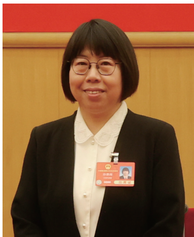
全国人大代表孙景南。

产业工人是工人阶级的主体力量，是实施创新驱动发展战略、加快建设制造强国的骨干力量。“当下，新质生产力给技能工人带来了知识更新、工作方式转变等方面的诸多挑战，特别是‘智改数转网联’浪潮之下，制造业的快速发展与技术进步对产业工人能力和素质提出更高要求。”作为一名来自产业一线的工人代表，全国人大代表、中车南京浦镇车辆有限公司车体分厂电焊工、中国中车首席技师孙景南一直期盼能推动更多关注，谋更多实招，为发展新质生产力夯实技能人才支撑。今年的全国两会上，她带来了《关于持续深化产业工人队伍建设改革的建议》。