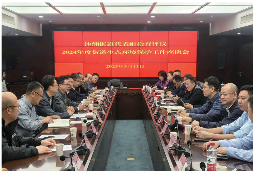
3月11日，建邺区人大沙洲街道代表组听取街道生态环境保护工作情况。

沙鸥翔集，锦鳞游泳，岸芷汀兰，郁郁青青，一派春和景明……这是游人对入选长三角区域园林绿化优秀案例的“爱情湾”生态公园的第一印象，也是建邺人与自然和谐共生的一幅生动画卷。