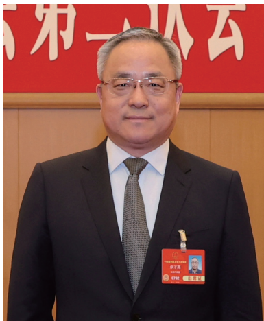
全国人大代表余才高。

在今年全国两会上，全国人大代表、中国城市轨道交通协会会长、市人大常委会环资城建委副主任余才高，建议国家有关部委支持江苏南京建设国际航空枢纽。他认为，江苏作为经济大省、开放大省，在国家现代化建设全局中占据重要地位，南京国际航空枢纽的建设对提升江苏乃至长三角地区的国际竞争力、促进区域协同发展意义重大。