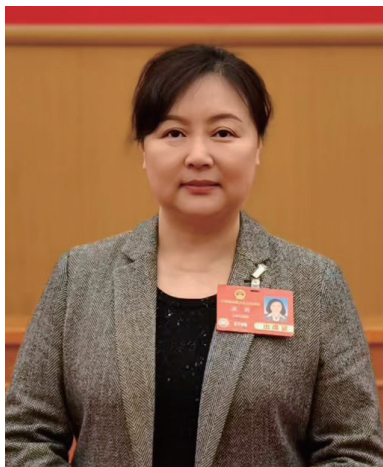
全国人大代表宋燕。

随着“博物馆热”的持续升温，越来越多人走进博物馆。值得一提的是，在我国的博物馆矩阵中，“藏在”高校里的博物馆也是不可或缺的一部分，但因为场馆开放能力、主动开放意愿相对较低等因素，高校博物馆往往“养在深闺人未识”。为此，全国人大代表、南京市博物馆总馆副馆长宋燕提出了进一步发挥高校博物馆教育功能的建议。