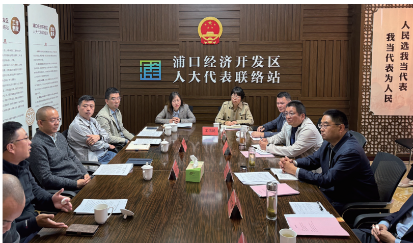
2024年11月12日，“代表·局长面对面”活动在浦口经济开发区人大代表联络站举行。

“亮项目建设、亮服务效能”行动（简称“双亮行动”）……邀请人大代表集中观摩江北虹悦城、南京国家现代农业产业科技创新示范区过渡载体共享实验室、纽路德新路文化艺术创意中心等近百个重点项目。近年来，浦口区人大常委会始终把推动高质量发展作为代表履职的主题主线，积极践行全过程人民民主，充分激发人大代表履职活力，通过代表履职与区域经济社会高质量发展深度融合，为中国式现代化浦口新实践汇聚智慧力量。