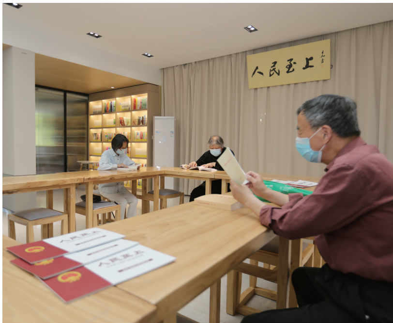
玄武区玄武门街道台城花园社区基层立法联系点里,社区居民在阅读法律书籍。

(三) 优化服务保障,代表主体作用较好发挥。代表履职根基进一步夯实。以开展“牢记嘱托 感恩奋进”学习实践活动为主线,通过多种方式为代表履职“充电赋能”。有计划组织代表向选民报告履职情况,确保一届内代表述职全覆盖。全面推广“江苏人大”APP使用,为代表日常履职提供信息化高效支撑。建立健全代表履职档案,部分区开展代表履职积分评价。认真组织完成人大代表换届选举、罢免、补选等工作。代表履职载体建设卓有成效。持续加强代表履职平台载体建设,在镇街、社区(村)层面建有101个镇街人大代表之家、1219个社区(村)人大代表联络站等基层履职平台,积极拓展专业代表履职平台建设,雨花台等区试点开展线上代表履职平台建设,市人大基层立法联系点和社会建设观察点协同推进,形成体系日渐完备、形式更加丰富、优势互补的代表履职“主阵地”。代表活动内容和形式更加丰富。积极探索开展“人代会精神宣传月”“集中调研月”“一述四联双平台”等代表主题活动,打造“地区四级代表联席会”等代表工作品牌。江宁等区建立代表联系民情联络员、联系街道议政代表、进网格等固定联系机制。溧水区白马镇建立“1110”代表联系制度。代表履职成果有效转化。通过帮助代表精准提出建议,认真督办建议,完善激励机制,努力实现建议工作两个“高质量”。本届以来,镇人大代表共提出建议477件,