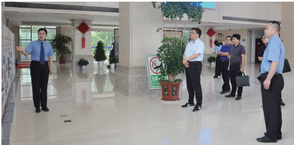
溧水区人大常委会组织立法联系点的人大代表调研人民法院溯源治理工作情况。