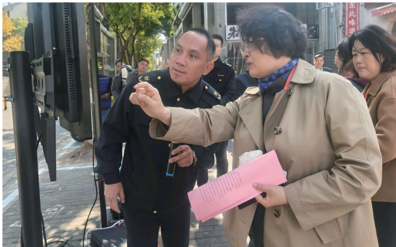
3月21日,建邺区人大常委会专题视察全区生态环境保护情况。图为代表现场观摩餐饮油烟动态监测系统,并与环境执法人员进行交流。