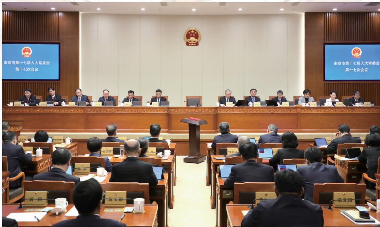
4月28日至29日，市十七届人大常委会第十七次会议召开。