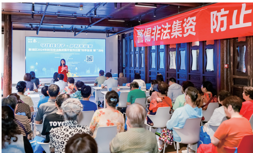
2024年6月15日，金融专业人大代表联络站开展“6·15”防范非法集资主题宣传。

五是普及金融知识，提高全民金融素养。创新合作共建机制，联合创立全省首个“市民商学院”品牌，成为市民财商教育的入口。通过沉浸式剧本、社区消费洞察等广大群众喜闻乐见的形式，满足市民群众学习金融知识、培育财富观念的需求，走好新时代群众路线，打造金融服务群众的秦淮样板。走进社区、企业，讲解投资理财、风险防范等金融知识，帮助群众树立理性的投资观念，提醒群众警惕高收益陷阱，防范金融诈骗，增强金融服务的社会性和公益性，真正让金融服务“接地气”。