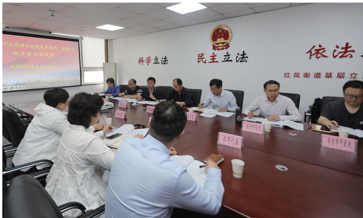
秦淮区红花街道基层立法联系点组织辖区人大代表召开座谈会，就《南京市中医药传承创新发展条例》听取代表们的意见建议。