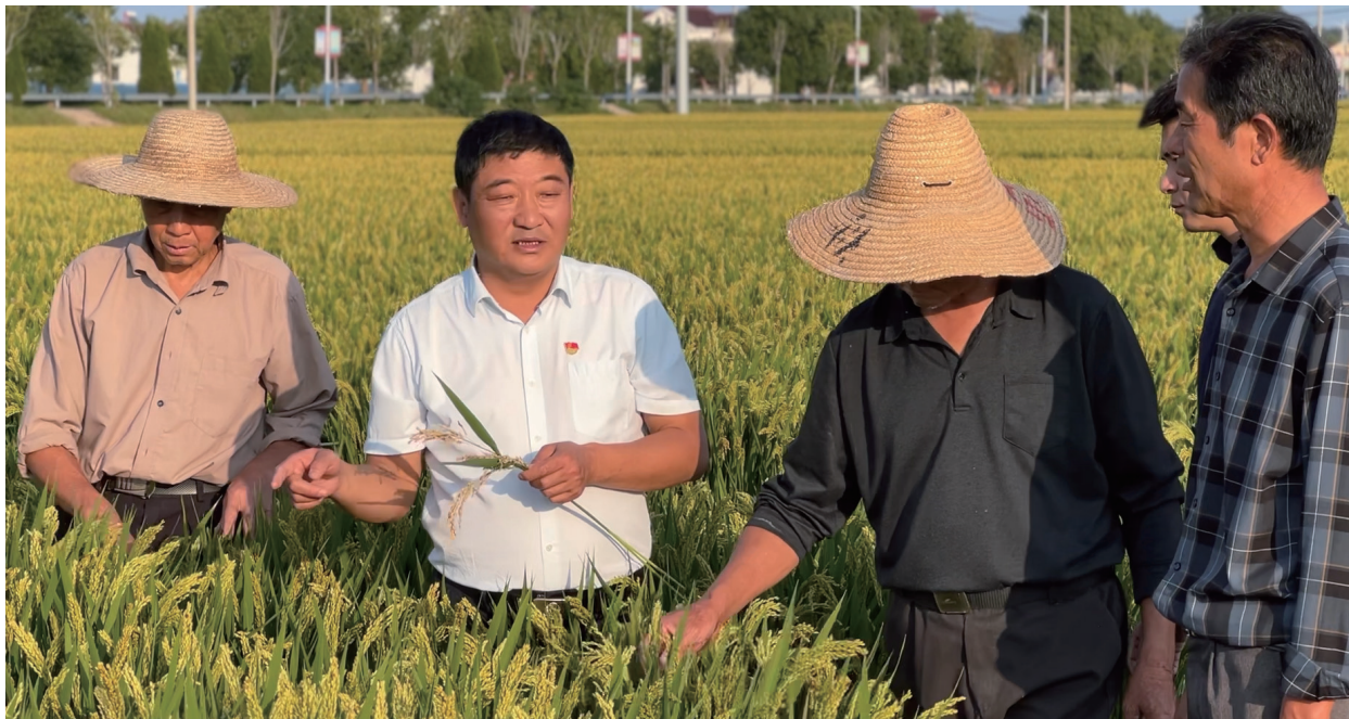
高淳区人大代表在田间地头为村民宣讲惠农政策。