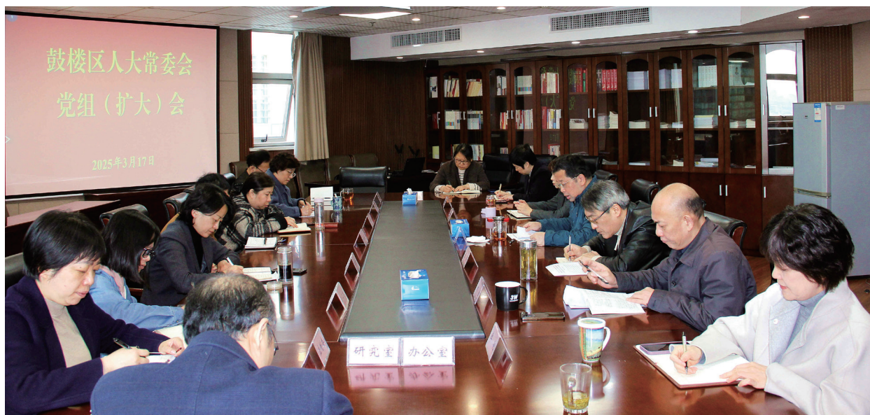
3月17日，鼓楼区人大常委会党组传达学习习近平总书记在参加十四届全国人大三次会议江苏代表团审议时的重要讲话精神和全国两会精神。