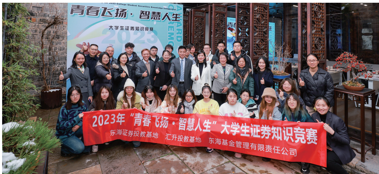
金融专业人大代表联络站组织开展“青春飞扬·智慧人生”大学生证券知识竞赛。