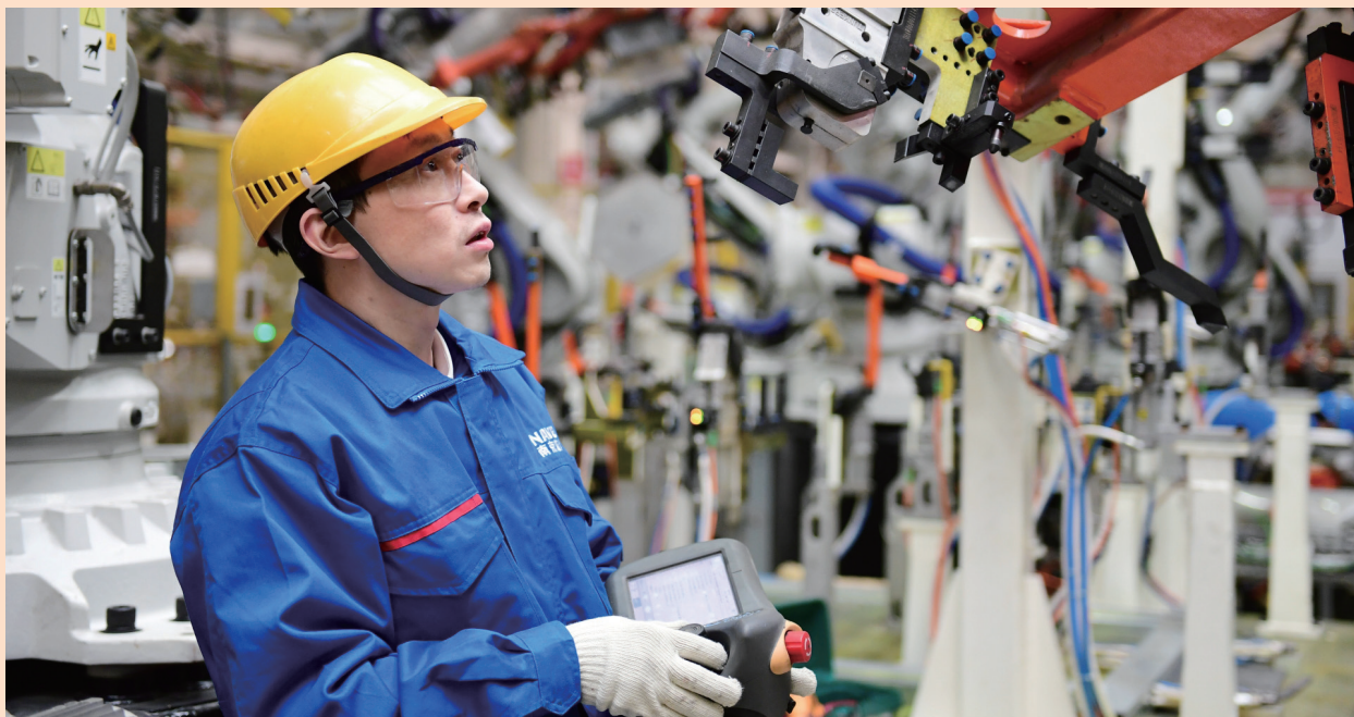
图为雍宁代表在工作中。