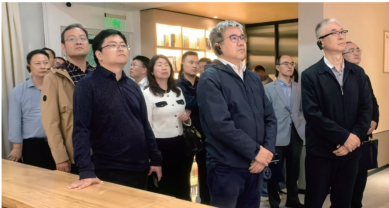
江宁区人大代表讲坛现场教学前往台城花园学习城墙根的议事平台。