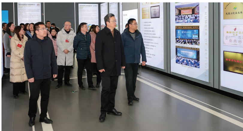
浦口区人大常委会组织人大代表集中视察重点产业发展情况。