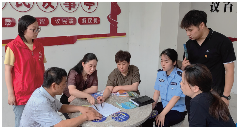
在淳溪街道栗园社区的“居民议事亭”，高淳区人大代表现场接待前来反映问题和寻求帮助的居民。