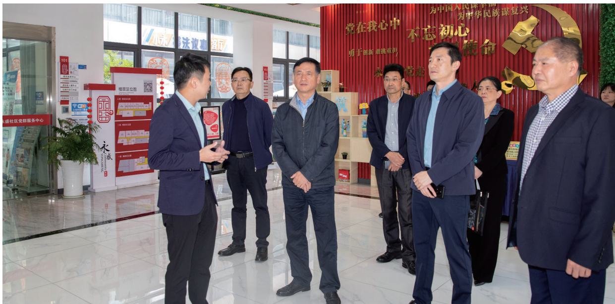
雨花台区人大常委会调研组调研西善桥街道永盛社区人大工作。