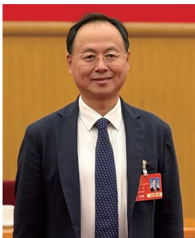
全国人大代表蒋立。

综合保税区是设立在内陆地区的具有保税港区功能的海关特殊监管区域，综保区作为开放层次最高、优惠政策最多的特殊功能区，不仅可进一步提升区域的对外开放水平，在推动地方经济发展和产业升级方面同样效果显著。