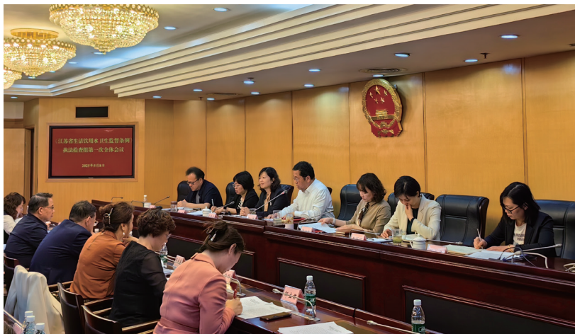
鼓楼区人大常委会召开《江苏省生活饮用水卫生监督条例》执法检查组第一次全体会议。

习近平总书记参加十四届全国人大三次会议江苏代表团审议时的重要讲话精神，进一步丰富和拓展了习近平总书记关于坚持和完善人民代表大会制度的重要思想。近年来，鼓楼区人大常委会聚焦“坚持好、完善好、运行好人民代表大会制度”这一使命任务，实干担当、笃定前行，以勤勉履职新作为，为推动中国式现代化鼓楼新实践作出了积极贡献。