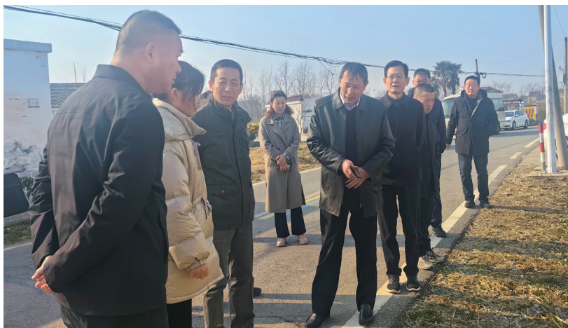
六合区人大常委会调研推进乡村全面振兴工作情况。

近年来，六合区人大常委会始终胸怀大局，切实扛起推进乡村振兴的人大担当。2022年至今，由区人大常委会领导分工督办重点人大代表建议共50项，其中有15件为涉农建议，占比达30%。围绕区委关于“产业强区 富民强村”的部署要求，六合人大连续四年将农业农村高质量发展作为重点工作议题，构建全方位监督格局。2022年4月，区五届人大常委会第三次会议审议区政府关于加快农业农村高质量发展，促进乡村振兴工作情况的报告，并进行专题询问；2023年6月，区五届人大常委会第十一次会议审议区政府关于农业社会化服务创新工