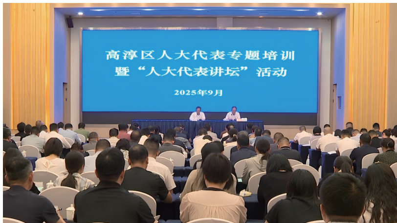
高淳区人大常委会开展人大代表专题培训暨“人大代表讲坛”活动。