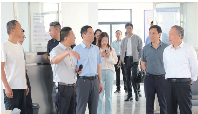
市、区、镇三级人大代表调研阳江镇人大代表履职平台建设成效。

代表法是规范和保障人大代表依法履职的基本法律，是全过程人民民主的“制度基石”，新修改的代表法更是为人大工作赋予了新准则、指明了新方向。高淳区人大常委会把建好代表履职平台作为发展全过程人民民主的重要抓手，把推动五级人大代表积极履职作为发挥人民代表大会制度优势的实践路径，持续提高服务能力、拓展联系渠道、创新工作方式，推动新法从“纸面规定”转化为实实在在的工作实践。