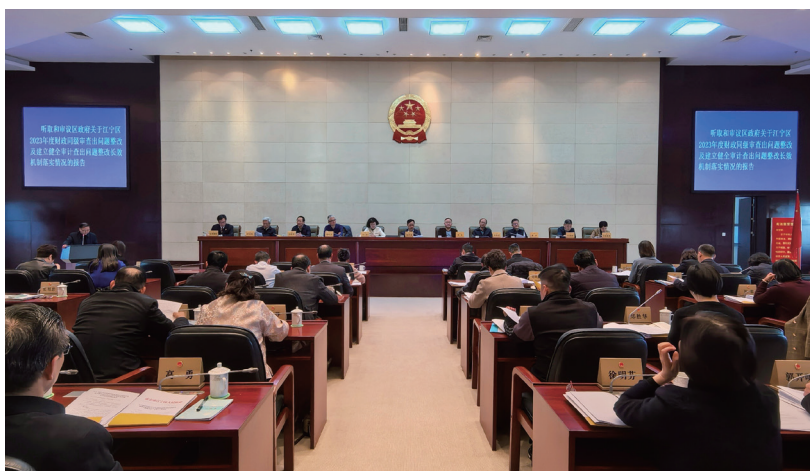
江宁区第十八届人大常委会第十九次会议听取和审议区政府关于江宁区2023年度财政同级审查问题整改及建立健全审计查出问题整改长效机制落实情况的报告。

“4”即加强“四支队伍”建设。注重发挥区人大财政经济委员会、财政经济代表专业组、预算审查专