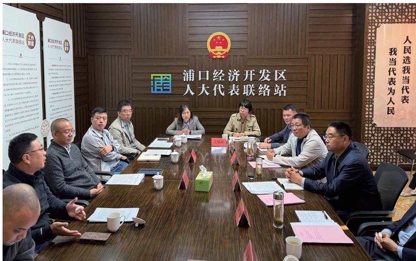
浦口经济开发区开展“代表·局长面对面”活动。

服务企业本就是政府部门的职责，人大搭建的交流平台让部门和企业沟通更加畅通无阻。代表们提出的很多意见建议都具有很强的前瞻性和指导意义，为政府部门转变思维、改进工作提供了强有力的支