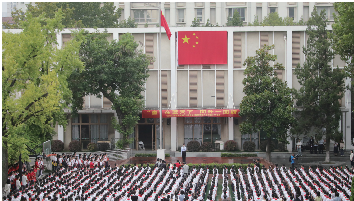
南京宪法公园讲解员给少先队员们讲解天安门国旗的故事。