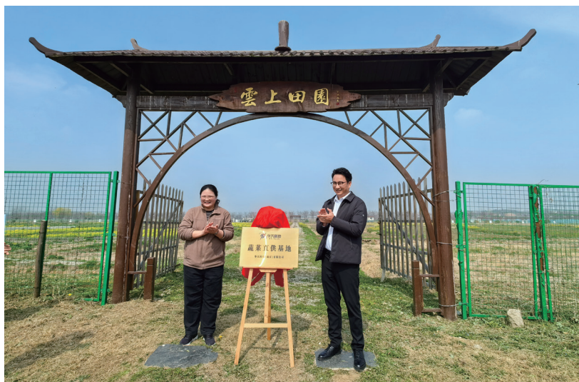
浦口区的两位市人大代表“跨界合作”共建蔬菜直供基地。