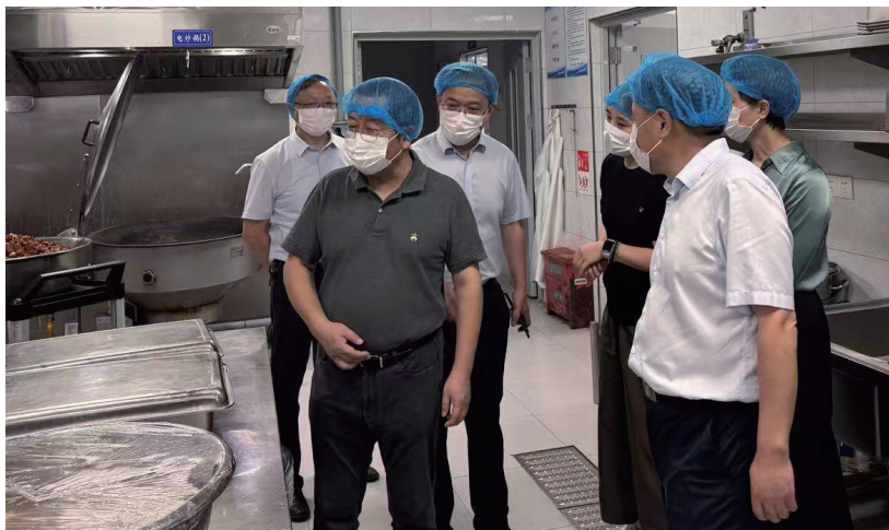
鼓楼区人大常委会在田家炳高级中学调研食堂净水设备使用情况。

习近平总书记关于“四个机关”的重要论述，对新时代人大自身建设提出明确要求。我们要深入开展“牢记嘱托、感恩奋进”学习实践活动，以模范机关建设新成效推动人大工作高质量发展。坚持把政治建设放在首位。牢记政治机关第一属性，更好发挥常委会党组把方向、管大局、保落实作用，提高政治判断力、政治领悟力、政治执行力。坚持把能力建设扛在肩上。拓展“会前学法”“机关讲堂”等学习载体，加强专业培训和多场景历练，不断提升人大干部“读懂人大制度”“讲好人大故事”“干好人大工作”的能力。坚持把作风建设挺在前面。开展深入贯彻中央八项规定精神学习教育，深入学习习近平总书记关于加强党的作风建设的重要论述，激励人大干部担当作为，推动在遵规守纪中改革创新、干事创业，努力打造政治坚定、服务人民、尊崇法治、发扬民主、勤勉尽责的人大工作队伍，以勇挑大梁的实际成效，为奋力谱写中国式现代化鼓楼新篇章贡献人大新力量。