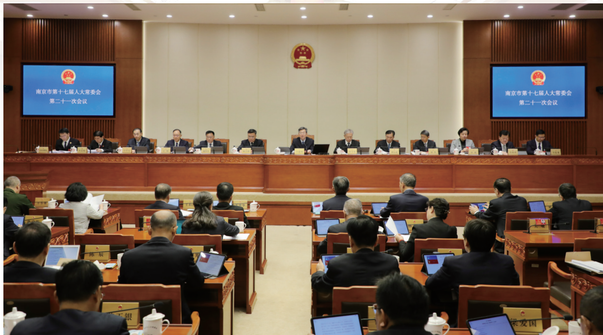
10月29日至30日上午，市十七届人大常委会第二十一次会议召开。