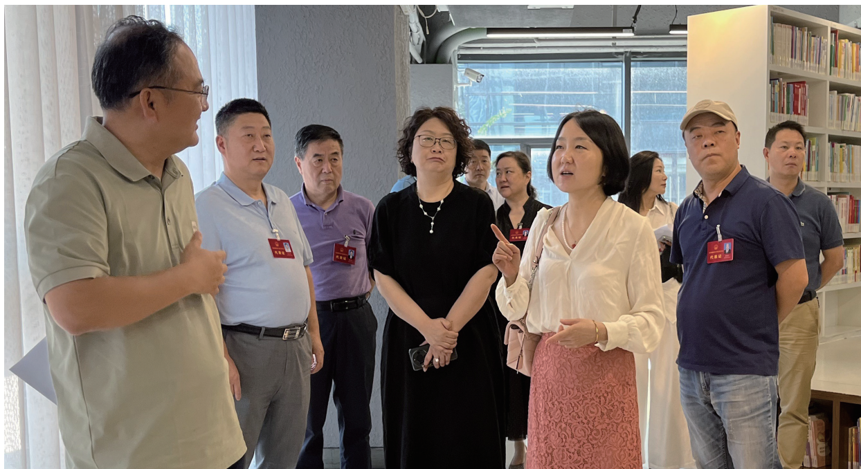
栖霞区人大代表仙林街道代表组视察文化惠民类民生实事项目推进情况。