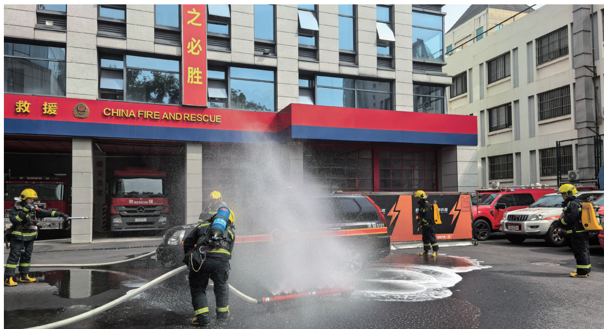
消防救援人员开展新能源汽车灭火演练。