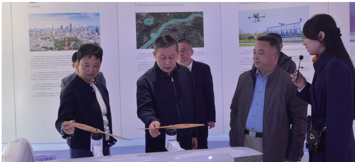
浦口区人大常委会调研浦口区低空经济发展情况。