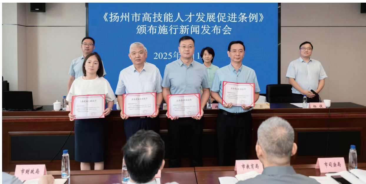
扬州市人大召开《扬州市高技能人才发展促进条例》新闻发布会，并现场向立法建议被采纳的人员颁发立法建议采纳证书。