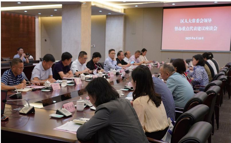
栖霞区人大常委会领导督办重点代表建议座谈会召开。

筑牢履职根基。坚持把党的领导贯穿于人大工作全过程各方面，坚决做到人大履职行权与全区中心工作同频共振、同向发力。坚持党管干部原则与人大依法任免有机统一，依法依规任免国家机关工作人员 252 人次，确保党的主张依照法定程序顺利实现。严格执行重大事项、重要工作向区委请示报告制度，确保人大工作方向正确、推进有力。切实发挥人大常委会党组把方向、管大局、保落实的领导作用，召开党组会议 54 次，及时传达学习中央及省市区委重要会议精神，研究部署重点工作。深化理论武装。严格落实“第一议题”制度，把政治理论学习列为常委会党组会议、常委