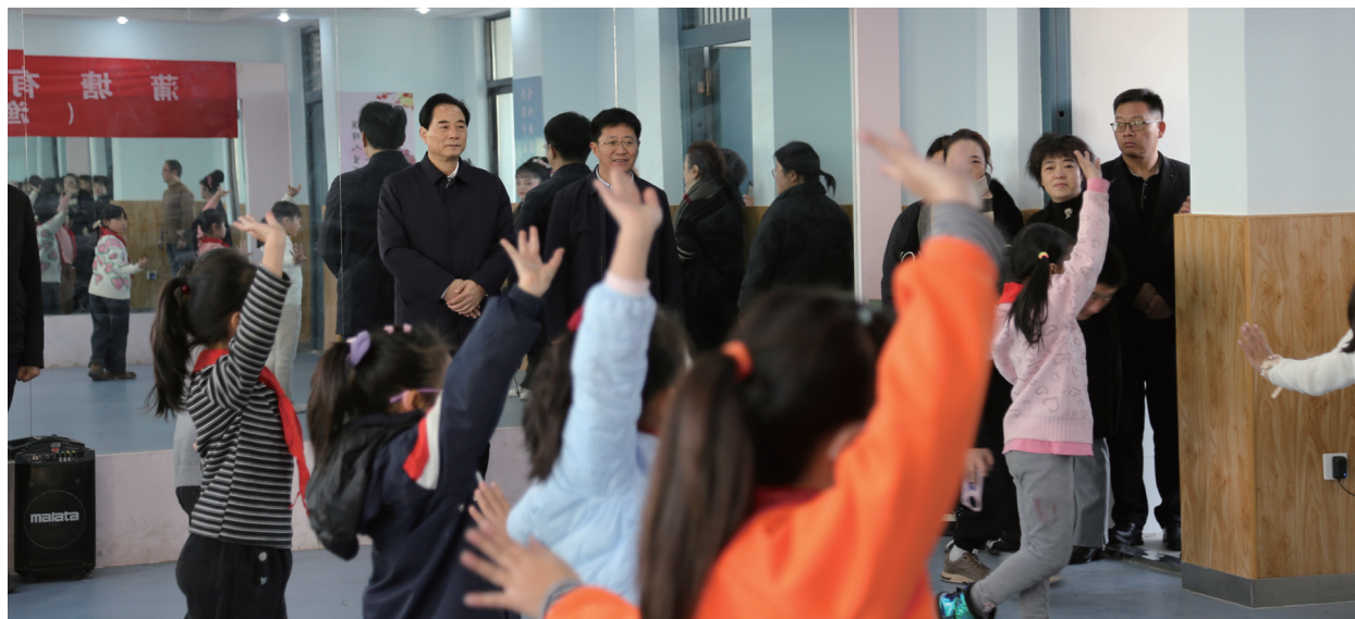
溧水区人大常委会调研推进石白湖沿线文化村建设。