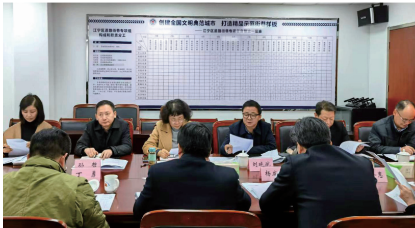
江宁区人大常委会开展部门预算预先审查。