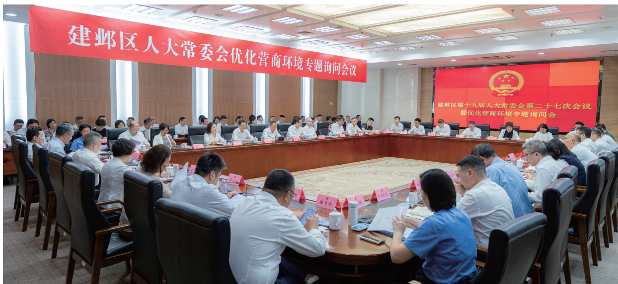
建邺区十九届人大常委会二十七次会议暨优化营商环境专题询问会召开。