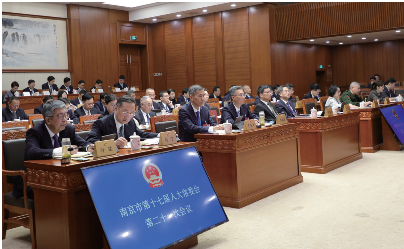
市第十七届人大常委会第二十一次会议召开。图为大会全景。