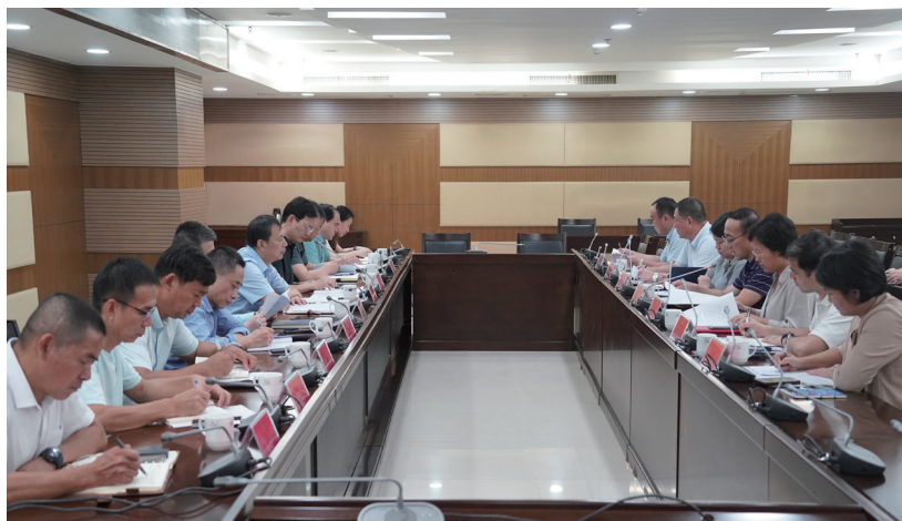
六合区人大常委会组织召开推进乡村全面振兴工作座谈会。

闭环监督，确保问后“必”改。会后立即梳理问题，形成“问题清单”与“责任清单”交“一府两院”及相关部门办理。及时建立整改台账，通过定期听取报告、组织实地视察等方式跟踪督办，实行销号管理，确保整改落地见效。多措并举，推动问后“深”改。综合运用多种监督形式，听取审议专项工作报告，聚焦产业、治理、环境等难点开展执法检查，保障《中华人民共和国乡村振兴促进法》等落地，组织专题调研，针对深层次矛盾提出对策，为决策提供精准靶向。依靠代表，助力问后“实”改。发挥人大代表桥梁纽带作用，邀请代表参与跟踪督办，成为整改“见证者”与“评判员”，同时利用代表家站点等平台收集民意，确保整改始终紧扣“惠及于民”的落脚点。六合人大以刚性监督之力，将乡村振兴的宏伟蓝图一步步变为棠城大地的现实图景，让发展成果真正成为人民群众可观可感的幸福生活。