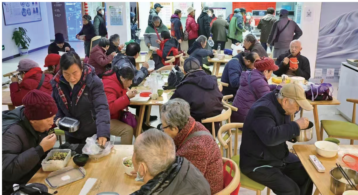
新街口街道悦心居家养老服务中心。