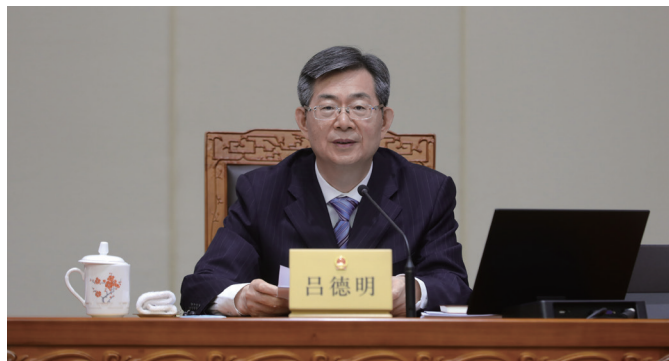
10月29日至30日上午，市第十七届人大常委会第二十一次会议召开。