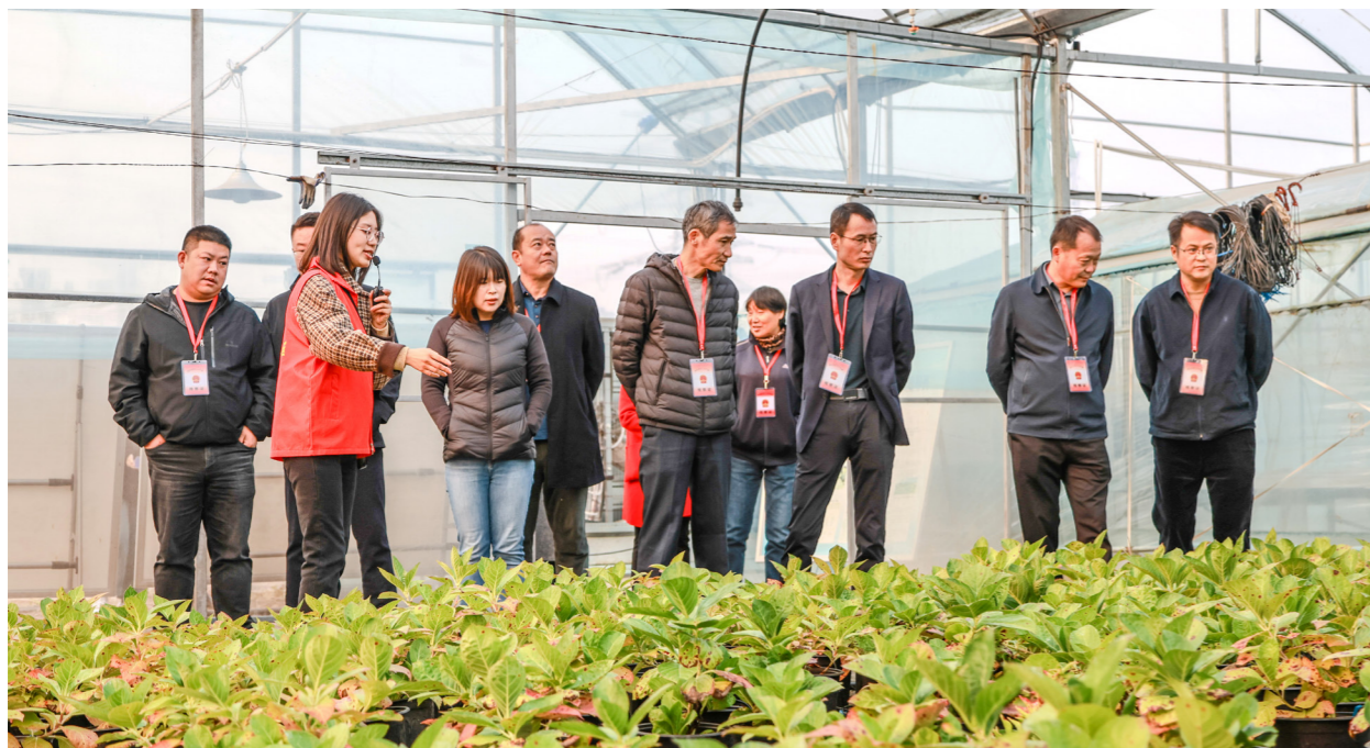
雨花台区人大常委会古雄街道工委组织区人大代表视察街道扶残助残民生项目。