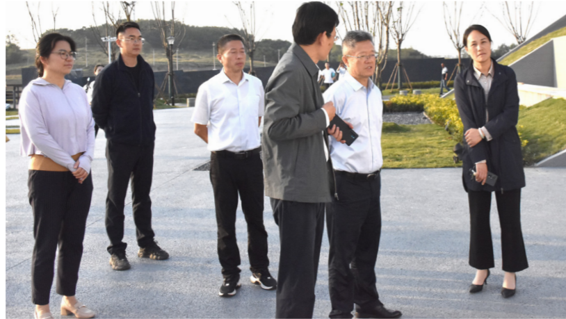
六合区人大常委会调研金牛湖街道“乡伴理想村”建设情况。

一、锚定制度构建，以“试点先行”夯实监督根基。 广泛征求1个镇、11个街道及相关职能部门意见，于2025年4月主任会议审议并通过了《关于试点建立六合区乡镇（街道）国有和集体资产管理情况监督工作方案》，明确监督主体、对象、内容、程序以及组织保障，为规范、有序开展镇街资产监督提供了明确的制度遵循。在具体路径上，采取“先行先试、以点带面”方式，选择基础条件相对成熟的竹镇镇作为首个试