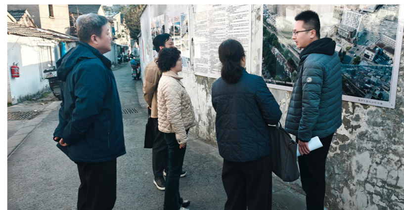
鼓楼区人大常委会对“十四五”期间部分项目进展情况进行实地检查。