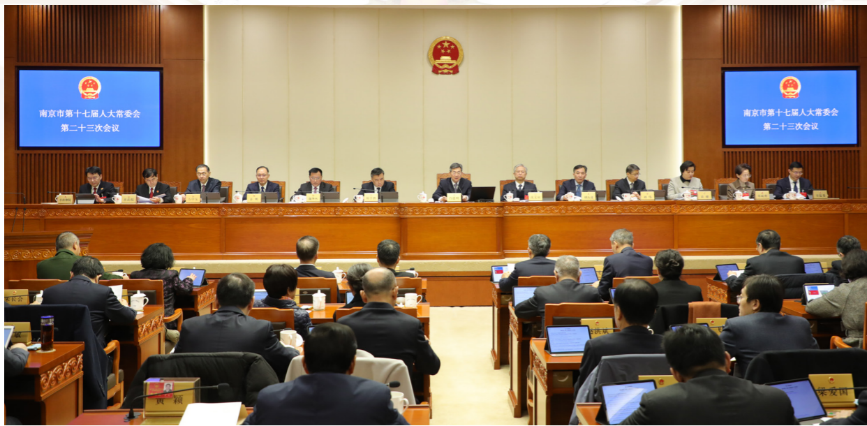
12月29日至30日上午，市十七届人大常委会二十三次会议召开。