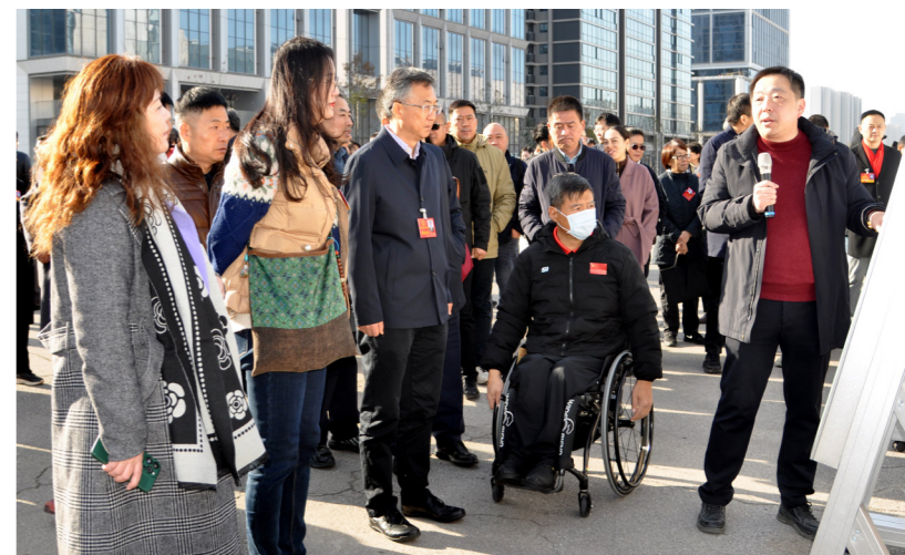
秦淮区人大常委会组织市、区人大代表集中视察南部新城重大项目建设情况。