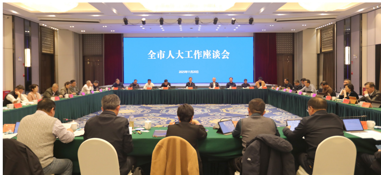
11月20日，全市人大工作座谈会召开。