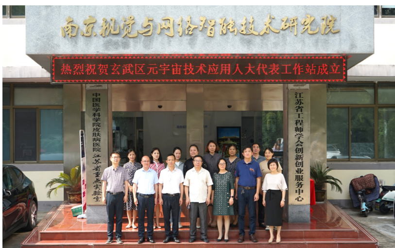
玄武区元宇宙技术应用人大代表工作站成立现场。

2025年11月20日，在玄武区人大常委会玄武湖街道工委会议现场，南京视觉与网络智能技术研究院与南京大头阿亮养老机器人有限公司达成战略合作，围绕“智慧养老”场景，推动智能机器人与人工智能技术在社区居家养老服务中的融合应用。这场没有繁琐仪式的签约，正是元宇宙技术应用人大代表工作站两年多实践的一个缩影——将前沿科技从实验室带进生活现场，让人大履职与科技创新同频共振，为服务新质生产力发展、增进民生福祉探索出一条务实路径。