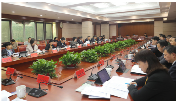
◀ 12月29日至30日上午，市十七届人大常委会二十三次会议召开。