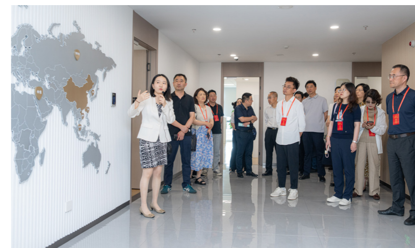
建邺区人大代表集中视察中石化化工物流有限公司。