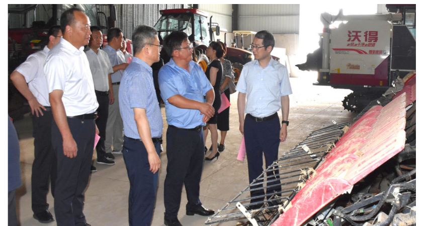
六合区人大常委会调研马鞍街道农机中心运维情况。