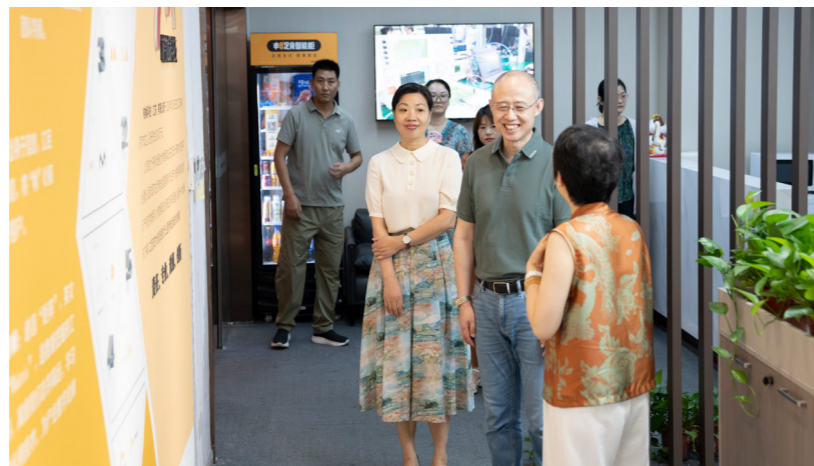
建邺区人大常委会开展“两个联系”活动，走访代表所在企业。

培训内容差异化。针对不同领域、不同层级代表的差异化需求，精准设计培训内容，从“大水漫灌”转向“精准滴灌”。编制优秀代表建议小册子，直观呈现高质量建议形成过程；增加调研方法实操、建议撰写指引等实用课程，切实解决代表“如