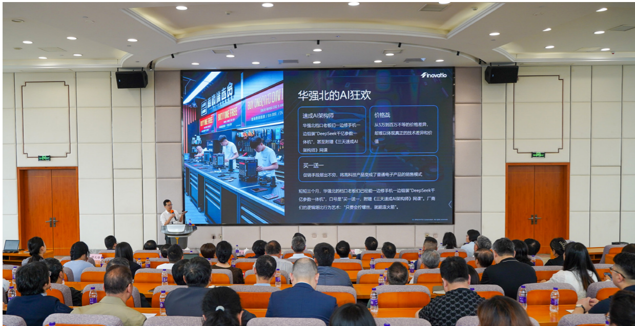
雨花台区人大常委会围绕加快新质生产力发展举办代表讲坛。