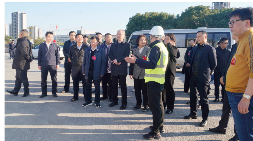
栖霞区人大常委会专题视察代表建议办理工作。