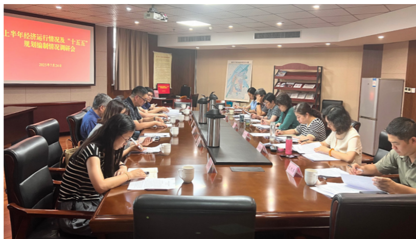
鼓楼区人大常委会召开上半年经济运行情况及“十五五”规划编制情况调研会。

2025年伊始，鼓楼区人大常委会便确立了清晰的行动指南，将习近平总书记对“十五五”规划编制工作及“十五五”时期经济社会发展的重要指示中所蕴含的先进理念、战略思维和科学路径，切实转化为调研和审查工作的行动指南与实践遵循，精心制定了开展“十四五”规划实施及“十五五”规划纲要草案编制情况调研和审查的工作方案，明确了指导思想、细化了主要内容、部署了工作安排、厘清了组织架构，确保整个调研过程方向明确、有章可循、精准发力，推动规划更好契合发展规律、符合鼓