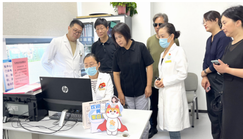
栖霞区人大常委会组织代表调研基层医疗机构慢病管理工作情况。

常委会始终将代表建议办理作为增强监督刚性和提升监督实效的重要抓手，通过完善督办机制、创新督办方式，着力构建权责清晰、运转高效、协同发力的督办工作闭环，持续推动建议办理从“有回音”向“有实效”转变。健全工作机制，压实责任链条。深化“领导领衔、专委会对口、区街联动”的重点建议督办机制，常委会领导带头领办难度大、涉及面广的综合性建议。今年遴选的15件重点建议，均由区人大各专门委员会、常委会工作机构和各人大街道工委进行全程跟踪、对口督办，确保督有重点、办有力度。区政府层面建立“主要领导负总责、分管领导直接抓、承办科室具体办”三级责任制，区人大常委会探索建立建议办理清单制度，实行挂图作战、销号管理，确保每一项建议都责任到人、时限明确、推进有序，形成人大与政府同题