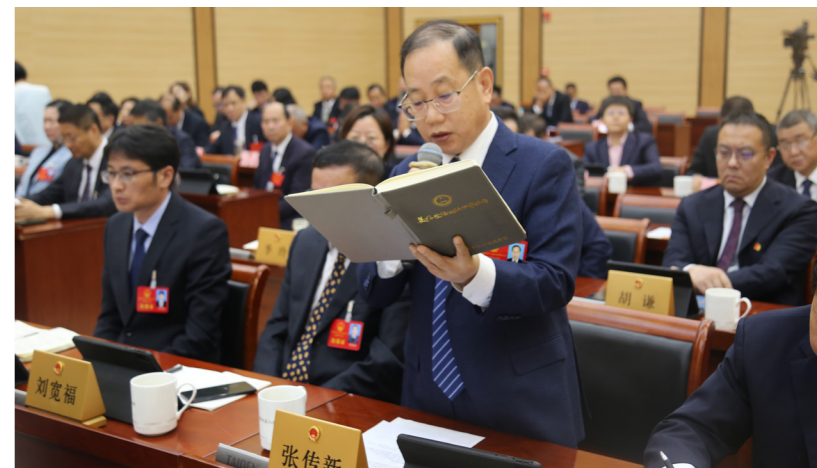
溧水区人大常委会对全区校园安全管理情况进行专题询问，常委会组成人员进行提问。