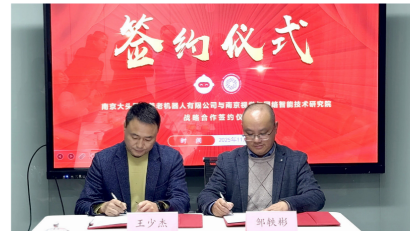
南京视觉与网络智能技术研究院与南京大头阿亮养老机器人有限公司签约仪式现场。