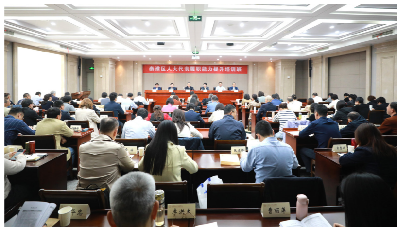
秦淮区人大常委会举办区人大代表和人大干部履职能力提升培训班。

中央八项规定自2012年出台以来，以其简明务实的风格，成为改进党风政风的标志性举措。八项规定聚焦改进调查研究、精简会议活动、规范出访活动、改进新闻报道等八个方面，核心是密切党同人民群众的血肉联系，解决形式主义、官僚主义、享乐主义、奢靡之风等“四风”问题，不仅是作风建设的规范，更是政治纪律的要求，体现了党中央以身作则、以上率下的坚定决心。在当前新形势下，学习贯彻中央八项规定及其实施细则精神具有更深远的意义。秦淮作为南京的老城区和主城区，承载着历史文化遗产与现代化发展的双重使命，人大工作将直接关系到区域治理与发展成效。在实际工作中，区人大