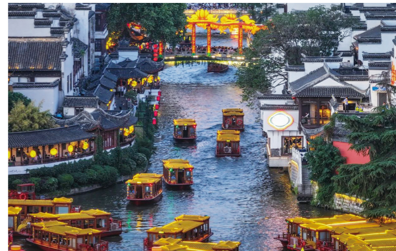
夫子庙“十里秦淮”风光带。

健全“权责清晰”的协同保护工作机制。《条例（修订草案）》拟发挥市区两级文化遗产保护传承工作协调机构作用，明确部门职责、属地责任及保护责任人制度，夯实区、镇（街道）两级政府保护职责，形成上下联动、齐抓共管的保护合力。