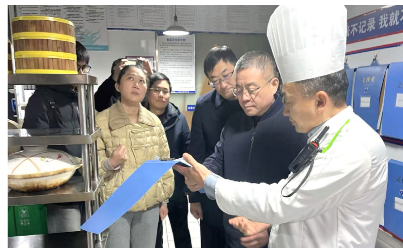
浦口区人大常委会围绕油烟防治治理开展调研。