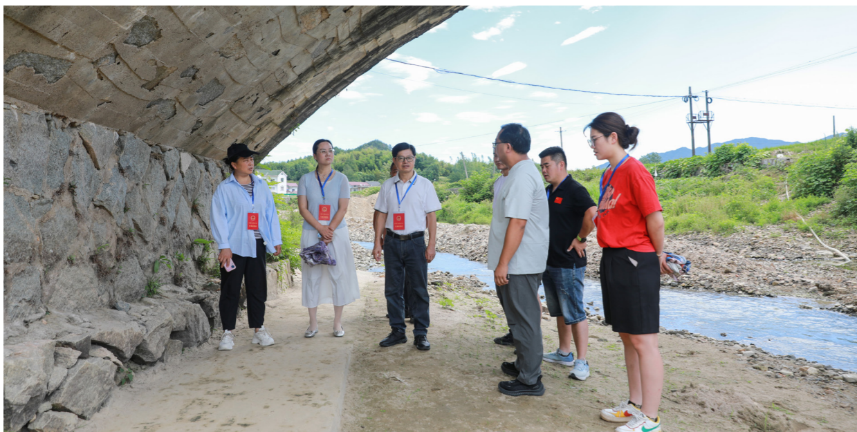
安徽省宣城市旌德县白地镇人大主席团对镇十四届人大五次会议期间提出的关于基础设施建设的重点建议办理情况开展专项督查。